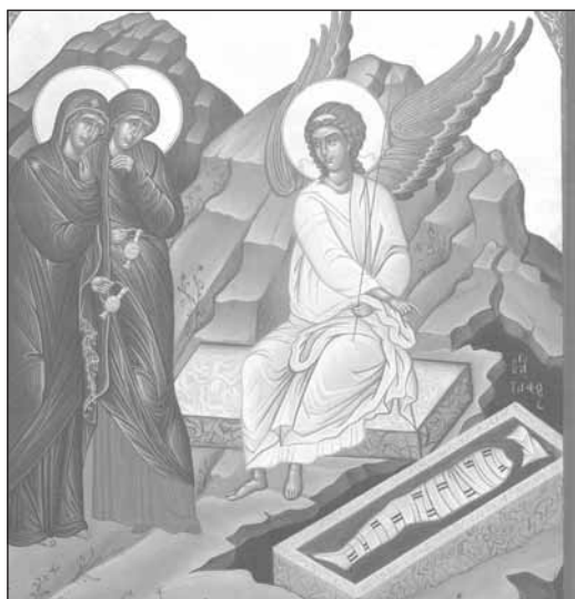
Femeile mironosile la morm`ntul gol. }n morm`nt se v[d giulgiurile.

Pentru o vreme, nimeni nu a scos nici un cuvânt. Când în v[\]toarea =i-a revenit, l-a întrebat pe George: