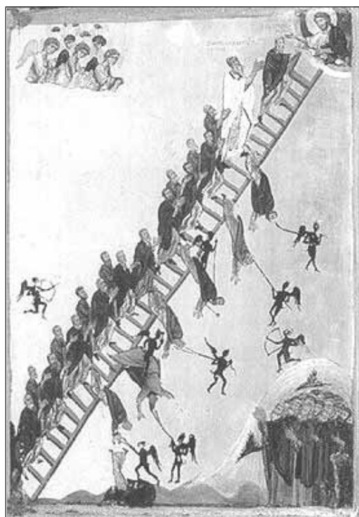
Scara Sf. Ioan

prima (Marcu 9, 17-32) relatează minunea vindecării copilului surdo-mut și îndrăcit, de către Mântuitorul, pe care ucenicii Săi n-au putut să-l vindece... De ce? Explică Mântuitorul: