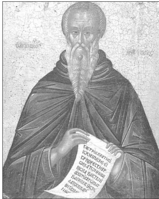
Sfântul Ioan Sc[rarul (579-649)

române=ti, mai întâi în manuscrise, apoi prin c[r\i tip[rite. Prima traducere româneasc[ o dator[m Mitropolitului c[rturar Varlaam al Moldovei, pe la anul 1600, iar ultima apar\ine p[rintelui profesor Dumitru St[niloae, tip[rit[ în Filocalia (vol. 9). În ultimii ani a fost reeditat[ =i separat, pentru a se veni în întâmpinarea tuturor cre=tinilor doritori s-o citeasc[ =i s[-i