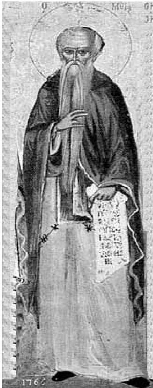
Sf. Sava al s`rbilor, primul arhiepiscop autocefal (1219-1233)

pravoslavac, care se traduce prin ortodox. Cu acest prilej aproximativ 2.200.000 de sârbi au fost masacra\i de c[tre statul independent Croa\ia. Acestei m[suri extreme i