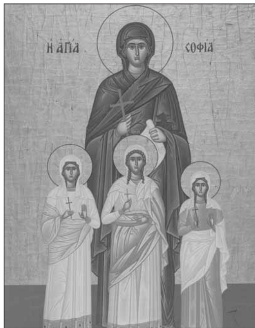
Sf. Mc. Sofia =i cele trei fiice ale sale: Pistis (Credin\). Agapis (Dragostea) =i Elpis (N[dejdea)

F [r[ dragoste ( l[s/m n[dejdea la urm[, nu întâmpl[tor ), nimic din cele ce înf[ptuim nu are valoare. Nici chiar credin\a. Cât de frumos se exprim[ iar[=i Sfantul Apostol Pavel: „De a= gr[i în limbile oamenilor =i ale îngerilor, iar dragoste nu am, f[cutu-m-am aram[ sun[toare =i chimval